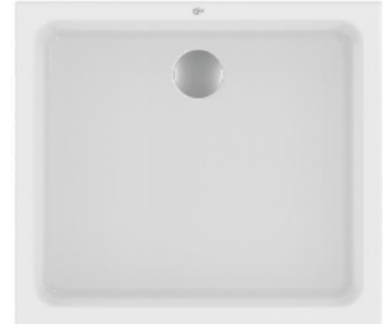
IDEAL Standard Hotline

Alternativ kann die Duschattrennung auch mit einer Acryl-Duschtasse 90 x 90 x 6,5 cm, Fabr. IDEAL Standard Hotline preisneutral montiert werden