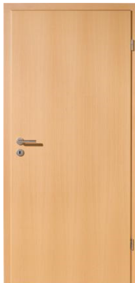
glatt Buche furniert