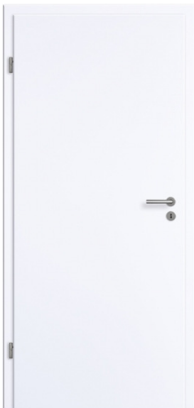
glatt weiß CPL