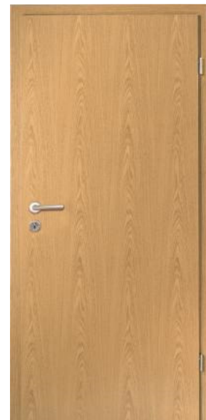
glatt Eiche furniert

Zur Echtholz furnier - Standardauswahl stehen Türelemente in Eiche und Buche, glatt furniert.