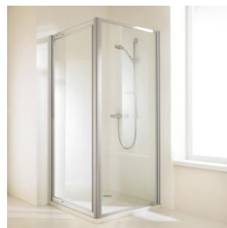
HÜPPE alpha, mit Einscheibensicherheitsglas